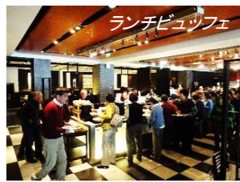
ランチビュッフェ