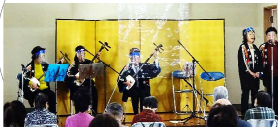
三味線の音色とともに 日本全国を巡りました！