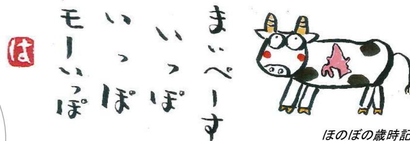
ほのぼの歳時記 大西晴雄さん作