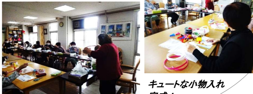
キュートな小物入れ 完成！