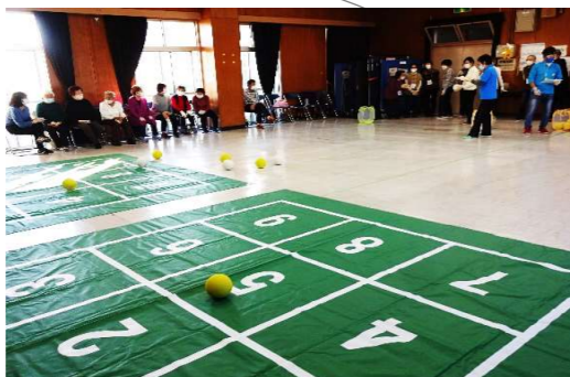
指導員さんもビックリ～！ パーフェクトもとびだしました ぐんぐん上達！