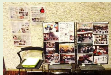
▲センターのコーナー