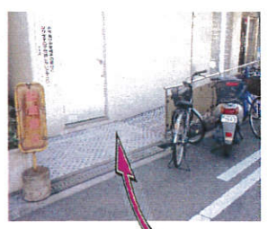
車いすの方の為にこの場所は 広く開けておいてください