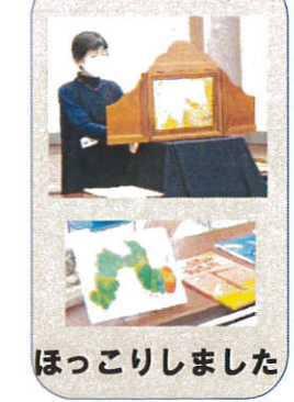
ほっこりしました