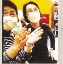
パチパチパチパチ