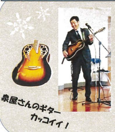
泉屋さんのギター カッコイイ!