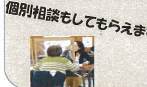
個別相談もしてもらえます