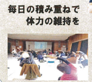
毎日の積み重ねで 体力の維持を