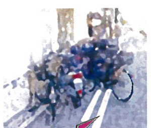
皆さまやご近所の方の安全の為にも 駐輪の際は白線の内側に止めてください 止めにくい時は右側の駐車場をご利用ください