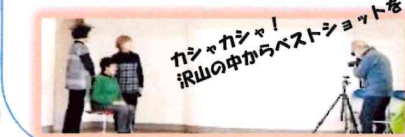
カシャカシャ! 沢山の中からベストショットを