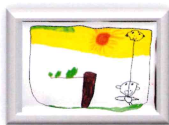
ひろばで すみっこぐらしのたこあげをしたよ