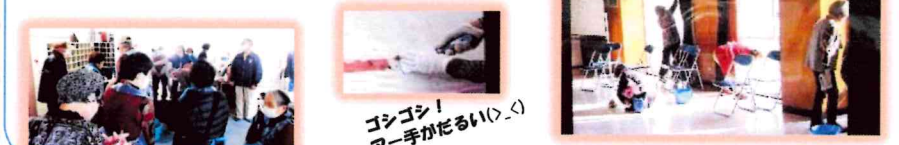
ゴシゴシ! アー手がだるい(>_<)