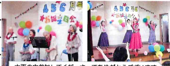
大雨の中参加してくださってありがとうございます