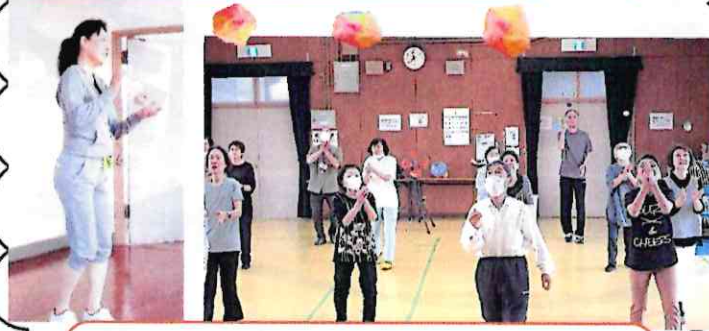
お手玉を上げながら歩く → フレイル予防