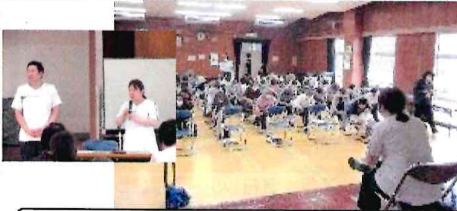
フレイル体操 皆さんの関心の高さに驚きました