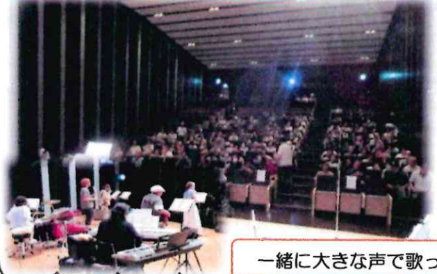
一緒に大きな声で歌ってとてもたのしかったと言いながら皆さん帰られました