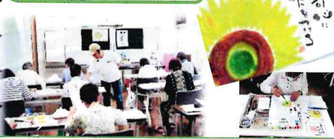
絵心なくても不思議と先生の指導で上手に描けました