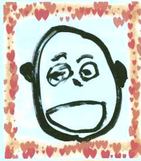
3歳の子が書いた自画像